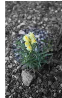
Leben - trotz allem