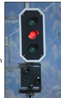
Sehen Sie rot?

Arbeit an den mit Ihnen vereinbarten Zielen mit Methoden aus Beratung, Psychologie und Pädagogik