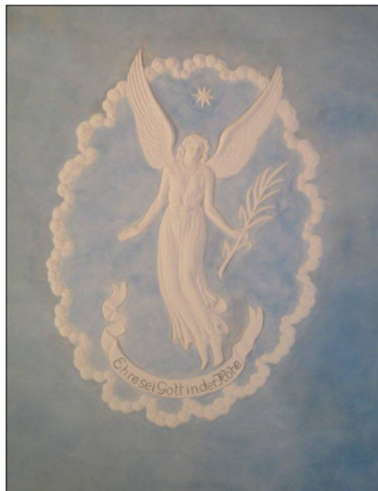
Der Engel verkündet: "Ehre sei Gott in der Höhe"

Sie symbolisiert mit ihrem aufgelockerten Blau ohne Zweifel den Himmel, und zwar den Himmel über der Erde, was mit dem naturbelassenen Braun des Bodens und der Bänke noch unterstrichen wird. Ein Kranz von Sternen säumt ihren Rand. Aber auch da wird nicht vergessen, dass wir in der Kirche des Wortes sind. In der Mitte der Decke schwebt ja ein Engel mit einem Palmzweig in der Hand, und zu dessen Füßen ringelt sich ein