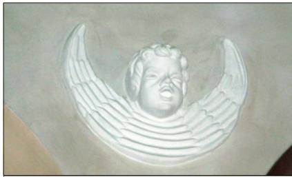
Engel oberhalb der Kanzel

zurufen: „Auch Du bist nichts aus Dir selber. Du bist nur der Vermittler einer Botschaft, die Du von Gott empfangen hast im Wort der Heiligen Schrift.