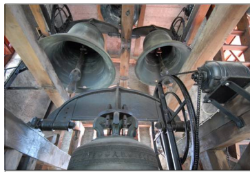
Drei der vier Glocken im Kirchturm

nicht wissen, wer damit gemeint ist, der Jünger Johannes (Markusevangelium 1, 19), der namenlose Lieblingsjünger (Johannesevangelium, 21, 20) oder ein Presbyter in Ephesus mit Namen Johannes. Evangelium heisst auf Deutsch „Gute Nachricht“. Die vier Figuren auf dem Turm, die übrigens durch die vier Wasserspeier auf dem Turmdach identifiziert werden (Mensch = Matthäus, Löwe = Markus, Stier = Lukas, Adler = Johannes), rufen uns zu, oft