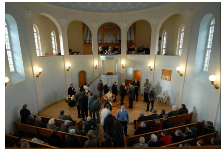
Feier des Abendmahls bei der Wiedereröffnung der Kirche nach der Renovation 2007

Wer aus einer katholischen Kirche kommt, dem fällt auf, dass kein Altar da steht, ja nicht einmal ein Tisch für das Abendmahl. Das geht zurück auf den Reformator Huldrych Zwingli, der das Abendmahl nicht mehr als ein Wundermahl verstehen wollte, bei dem Brot und Wein sich durch die Weihe des Priesters in den wahren Leib und das wahre Blut Christi verwandeln (Transsubstantiation), sondern