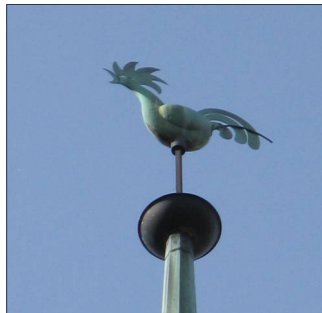
Der Landquarner Turmhahn

Auf der Spitze des Kirchturms steht bei den Reformierten in der Regel ein Hahn. Er hat die Funktion einer Windfahne. Aber warum gerade ein Hahn? Es gibt 2 Deutungen. Die 1. sieht im Hahn einen Aufruf zur Wachsamkeit, und zwar im Blick auf die Wiederkunft Jesu und den Anbruch des Reiches Gottes. Diese Deutung nimmt Bezug auf Markusevangelium 13, 33-37. Die 2. deutet den Hahn auf die Geschichte von der Verleugung Jesu durch Petrus