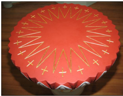
Blick auf den Taufstein

Der Taufstein zeigt keine Darstellung biblischer Szenen. Das Thema „Taufe“ wird ja direkt dahinter im Frontrelief der Kanzel aufgenommen. Er ist einfach mit schönen Verzierungen geschmückt und hebt sich mit seiner Farbigkeit von der Kanzel ab wie die