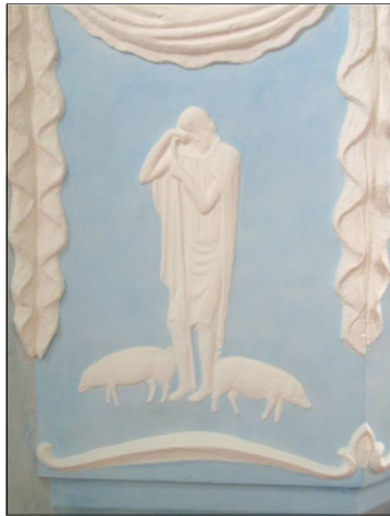
Gleichnis vom verlorenen Sohn