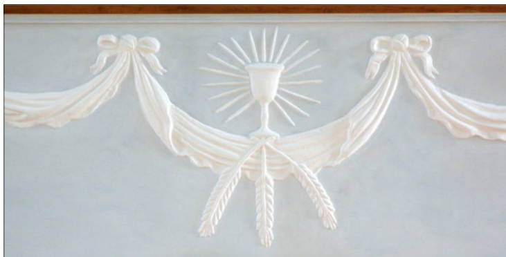
Relief mit Ähren und Kelch an der Brüstung der Turmpore

In der Mitte der Verzierungen an der Emporenbrüstung über dem Ausgang ist noch etwas zu sehen, was leicht übersehen wird, aber keineswegs unwichtig ist: ein Büschel Ähren und darüber ein Kelch, aus dem Strahlen hervorgehen. Es ist natürlich ein Hinweis auf das Abendmahl, das ja sonst im Kirchenschmuck nirgends vorkommt. Es ist wohl kein Zufall dass dieser Hinweis auf das Abendmahl ausgerechnet über dem Ausgang zu finden ist. Ich