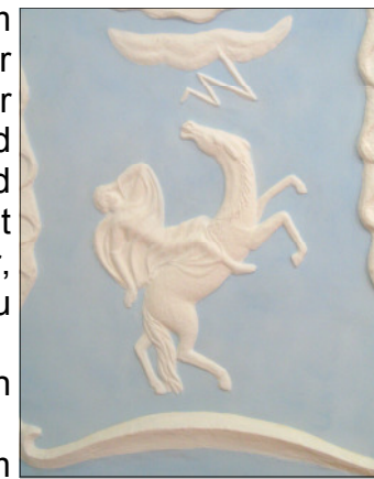
Saulus Paulus vor Damaskus

durch welches aus dem Christenverfolger der grösste Christenmissionar aller Zeiten wird. Links und rechts des Taufbilds wird festgehalten, was der Inhalt des Auftrags Jesu war, nämlich das Verlorene zu suchen und zu retten. Das geschieht anhand von zwei Gleichnissen: Links das Gleichnis vom verlorenen Sohn, der das