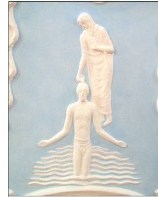
Relief: Taufe Jesu durch Johannes

Die Kanzel ist geschmückt mit vier Reliefs. Auf der Frontseite sehen wir die Taufe Jesu durch Johannes den Täufer. Für Jesus war dies der Moment seiner Berufung zu seinem Dienst als Sohn Gottes: „Du bist mein geliebter Sohn, an dir habe ich Wohlgefallen gefunden.“ (Markusevangelium 1, 9-11).