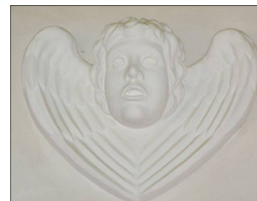
Einer der Engel zwischen den Fenstern

Die Begegnung mit den Hirten schliesst mit den Worten: „Und auf einmal war bei dem Engel die Menge des himmlischen Heeres, die lobten Gott und sprachen: Ehre sei Gott in der Höhe und Friede auf Erden....“ Die Engelsköpfe oben zwischen