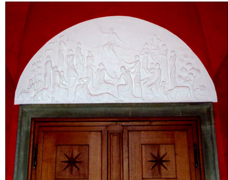
Relief über der Eingangstüre: Die Bergpredigt

Über die Treppe oder über die Behindertenrampe kommen wir durch ein Gittertor in einen roten Vorraum. Er knüpft mit seiner starken Farbigkeit an das bunte, oft sogar grelle Leben an, das uns draussen in Atem hält. Dass es jedoch im Innern der Kirche um etwas ganz Anderes geht, das bezeugt uns das Relief über der massiven Holztüre.