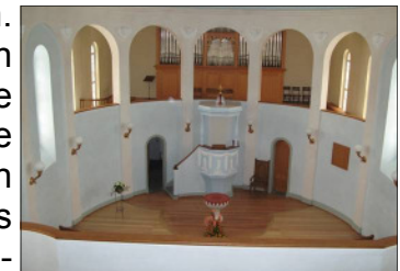
Orgel von Turmempore aus betrachtet

Die Orgel mit ihrer imposanten Pfeifenfront droht in ihrer heutigen Form den Kirchenraum zu dominieren. Das soll so nicht sein. Auch die Orgel, so schön und wichtig ihre Stimme ist, soll wie alles andere nicht dominieren, sondern dienen. Die Einbettung ins diskrete Gelb des Emporenhintergrunds soll diese