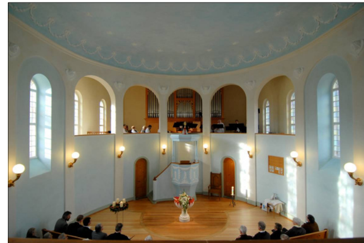
Die Architektur widerspiegelt Grundgedanken des Reformiertseins

umfasst, was sich im Raum befindet: den Ort der Predigt, den Ort der Sakramente (Taufe und Abendmahl) und den Ort der Gemeinde (Bänke). Auch dieser Raumgedanke ist wieder urreformiert. Es gibt da keine Trennung zwischen dem Chor als dem Ort der Priester und dem Schiff als dem Ort der Laien. Das niedrige Podium hat lediglich praktische Gründe. Es hilft, besser zu sehen und zu hören. Es gibt eben in der Reformierten Kirche keine Unterscheidung zwischen einer geweihten Priesterschaft und dem gewöhnlichen Volk (Laien, griechisch: Laos = Volk). Es gilt das Prinzip des allgemeinen Priestertums (1. Petrusbrief 2, 9), nachdem grundsätzlich jedem Glied der Gemeinde die gleiche Würde und das gleiche Recht zukommt. Die reformierten Pfarrer empfangen darum keine Weihe, sondern lediglich eine Ordination, d.h. eine Be-