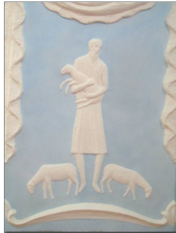
Gleichnis vom guten Hirten

väterliche Erbe verjubelt und verludert hat und nun bei den Schweinen gelandet ist (Lukasevangelium 15, 11-32), und rechts das Gleichnis vom verlorenen und wieder gefundenen Schaf (Lukas 15, 3-7). Der gute Hirte trägt es auf seinen Armen.