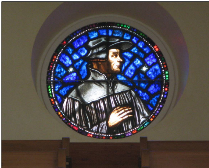
Rundfenster mit dem Bild des Reformators Huldrych Zwingli

Es zeigt heute das Bild des Zürcher Reformators Huldrych Zwingli. Ursprünglich fehlte dieses Bild. Das Rundfenster sah einfach aus wie das heute unsichtbare Pendant hinter der Orgel. Dass es hinzugekommen ist, hat aber seinen guten Sinn. Der ganze Kirchenraum atmet ja sehr deutlich den Geist des Reformators.