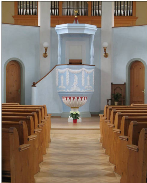
Blick vom Eingang zum Taufstein und zur Kanzel

Wenn wir die Türe öffnen, empfängt uns eine grosse Überraschung. Der Raum, der sich uns auftut, ist ganz anders als der grellrote Vorraum.