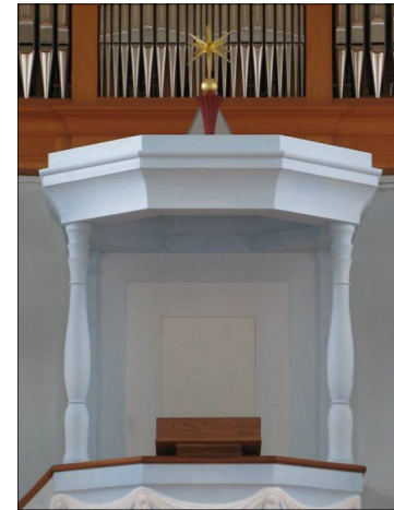
Der Stern auf dem Dach der Kanzel

Er weist unsern Blick hinauf zur Decke, hinauf zum Himmel. Dieses Hinaufweisen war ursprünglich noch eindrucksvoller, da die Orgel nicht in der Mitte der vorderen Empore stand, sondern aufgeteilt in 2 diskret bemalten Teilen, je links und rechts. Dazwischen öffnete sich der Blick auf ein helles, sonnenähnliches Rund-